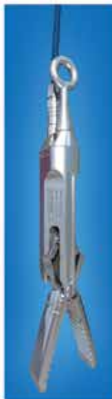
ユニバーサルジョイント