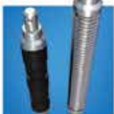
フレキシブルジョイント