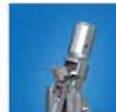
マグネットツール