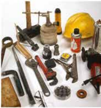
JAWS 2.0は様々な落下物を見つけ、回収することができます